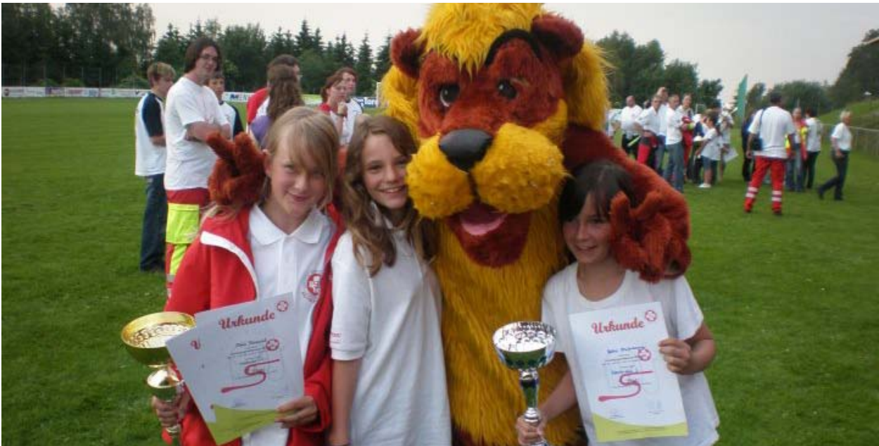
Glückliche Sieger beim Samariterbund Landesjugendwettbewerb in Groß Gerungs, Niederösterreich.